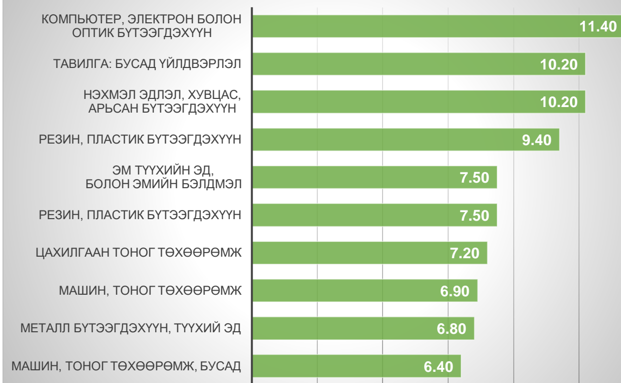
Зураг 2: Бараа бүтээгдэхүүний үнийн өсөлт хувиар