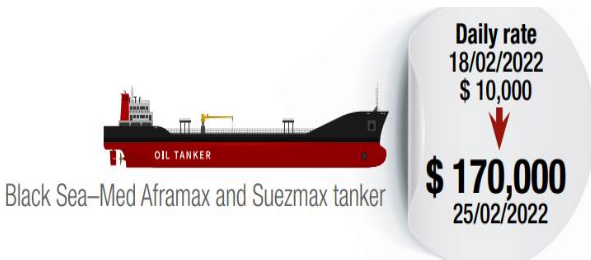
Зураг 1: Aframax болон Suezmax танкер хөлөг онгоц орлого

Хар тэнгис болон Балтийн тэнгисийн бүсийн нефтийн худалдааны гол тээвэрлэгч болох жижиг хөлөг онгоцнуудын тээврийн зардалд аль хэдийн хүчтэй савалгаа харагдаж эхлэв. Хар тэнгист далайн тээвэр хийдэг Aframax болон Suezmax танкер хөлөг онгоцны орлого 2022 оны 2-р сарын 18-нд өдөрт ойролцоогоор $10,000 байсан бол 2022 оны 2-р сарын 25-нд $170,000 гаруй ам.доллар болж өссөн байна. Үндсэн ачаа тээврийн зардал 400 орчим хувиар өссөн байна. Зураг 1-т харуулав.